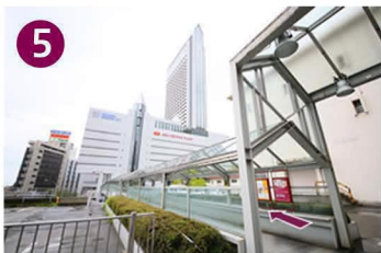
左手にホテルへの連絡橋がありますので