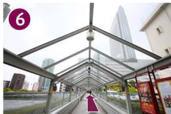
その標を渡り、エスカレーターで3階から4階に上がるとロビーです。