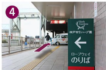
そのまま西へまっすぐ