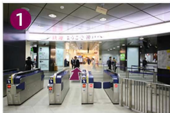
新幹線の改札を出て