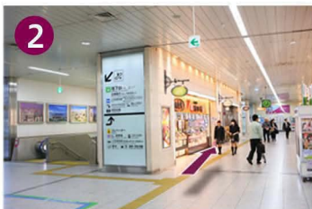
お土産店とお弁当屋の間を抜けて